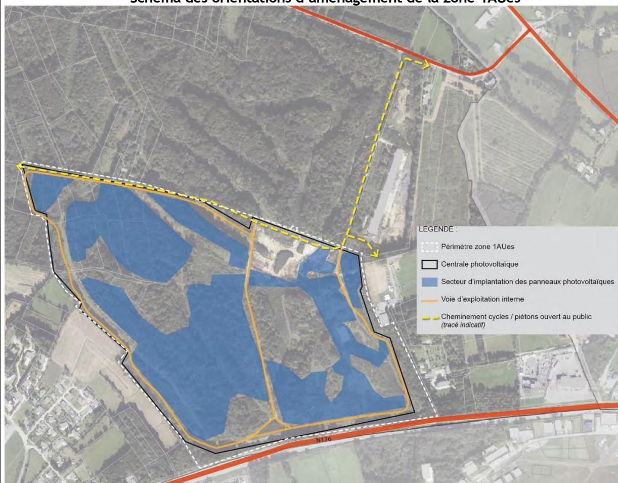
Schéma des orientations d'aménagement de la zone 1AUes